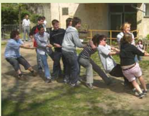
Schüleraustausch mit Ungarn