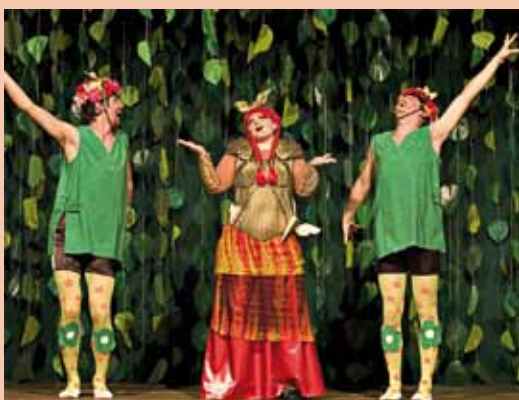
FOSBOS-Theater „Siegfried - Götterschweiß und Heldenblut“