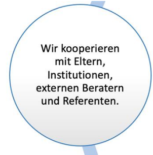
Abbildung 1: Ausschnitt SQV

Im Folgenden werden die Ziele und entsprechenden Maßnahmen an der Beruflichen Oberschule in Augsburg näher erläutert.